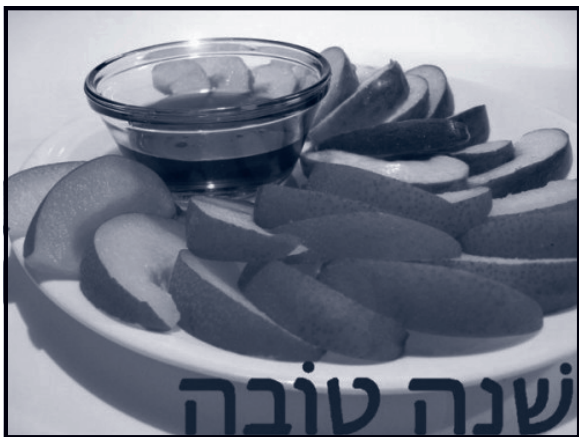
Bij Rosj Hasjana eet men appel en honing, symbolen voor een zoet nieuw jaar. In het Hebreeuws (van rechts naar links) de tekst: Sjana Tova.

Nisan. In het voorjaar. Dat is volgens Exodus 12 vers 2 de eerste maand: 'Voortaan moet deze maand bij jullie de