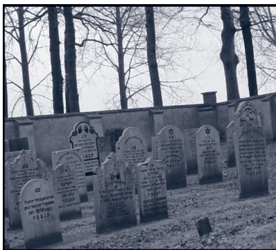
De Cohens liggen begraven tussen de andere overledenen.

Bij de begraafplaats werd erg duidelijk dat we hier met een Joods gezin te maken hadden. Ik hoefde hun niet te vragen wat dat kanneltje met schaal- tje toch zou kunnen betekenen, wat die twee handen ons te